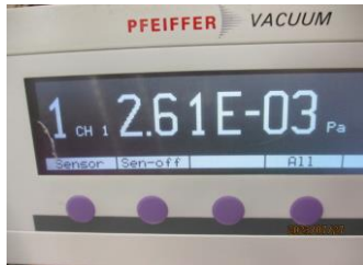
ノーマル切り替わり時圧力